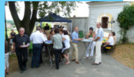
Gemütliches Beisammensein am St. Margarethen Sonntag

Ein gesegnetes Weihnachtsfest und ein gutes Neues Jahr wünscht Ihnen Ihr Pfarrgemeinderat!