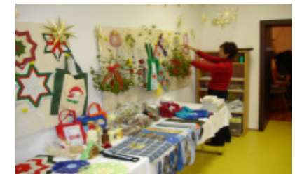
Die Handarbeiten vom Weihnachtsbasar