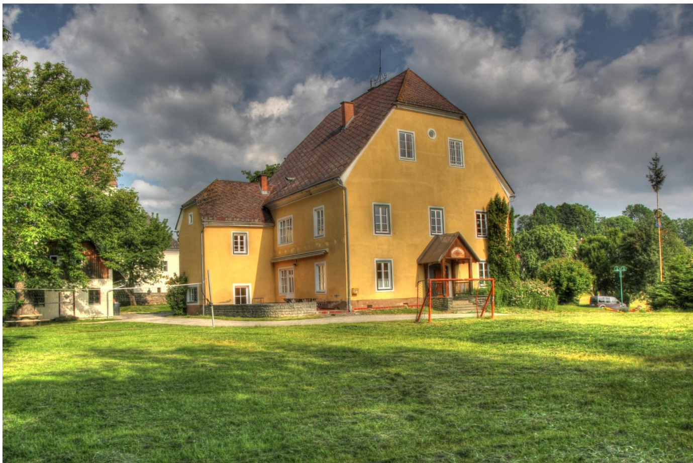
Abbildung 1: Fußballplatz, Volleyballnetz, Tischtennistisch und eine beschattete Terasse gibt es beim Jakobihaus