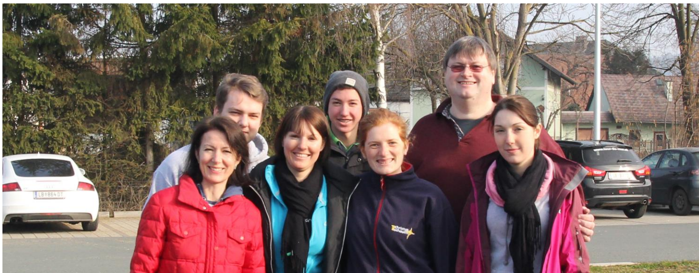
Abbildung 2: Zur Qualitätssicherung waren wir im Jakobihaus schon „probewohnen“